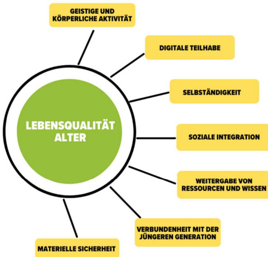
Abbildung 2: Sieben Pfeiler der Lebensqualität Alter