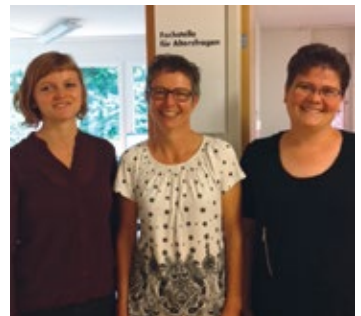
Team Fachstelle Breitenbach