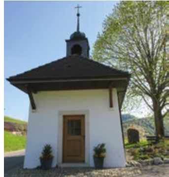
Kapelle St. Wendelin

Die Kirchgemeinde Bärschwil gehört dem Pastoralraum Thierstein an. Die Kirche ist dem Heiligen Lukas geweiht, Patrozinium ist am 18. Oktober. Die Kirche wurde 1548 im Stil der Spätgotik errichtet und 1727 sowie 1928 umgestaltet.