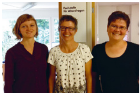
Team Fachstelle Breitenbach